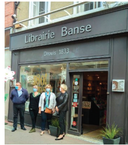
FECAMP Visite et soutien aux librairies