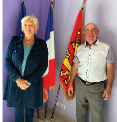
Suite aux élections municipales, rencontre avec les nouveaux élus ici à TOUFFREVILLE SUR EU