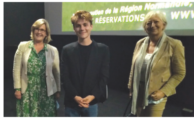
FECAMP Cinéma Le Grand Large avant-première du long métrage de François Ozon «Eté 85»