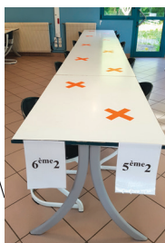
DARNETAL Covid-19 Découverte du dispositif sanitaire mis en place pour la réouverture du collège