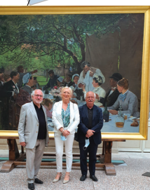
ROUEN Festival Normandie Impressionniste