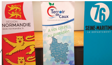
BACQUEVILLE EN CAUX Signature du contrat de territoire Région-Département Communauté de communes Terroir de Caux