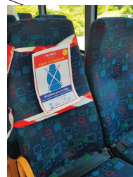
CLERES Covid-19 Aménagement des bus scolaires par la région Normandie