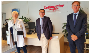
YVETOT Visite de l'hebdomadaire régional «Le courrier Cauchois»