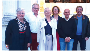
MESNIERES EN BRAY Concert de l'Art et la Manière En présence des élus de la Communauté de communes de Londinières