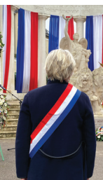
ROUEN Cérémonie du 11 novembre