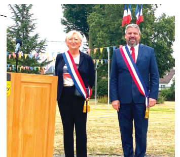
GOURNAY EN BRAY Cérémonie du 14 juillet