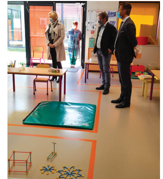
NEUFCHATEL EN BRAY Covid-19 Découverte du dispositif sanitaire mis en place pour la réouverture de l'école en présence du DASEN