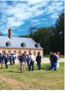
AUBERVILLE SUR MER Mairie de Auberville sur Mer