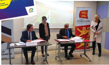
YVETOT Signature de la convention « Impulsion Relance Normandie » Région - Communauté de communes de la Région d'Yvetot Normandie