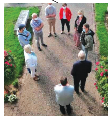
SAINT AIGNAN SUR RY Rentrée des classes