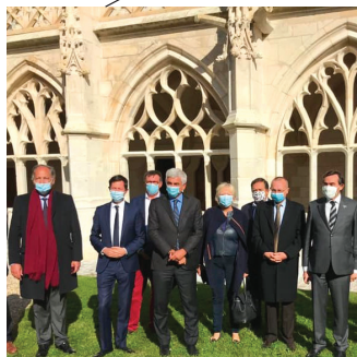
SAINT WANDRILLE - RANCON Inauguration de l'aile Est du Cloître de l'abbaye