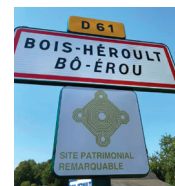
BOIS-HEROULT Dévoilement du premier panneau d'entrée de ville en normand