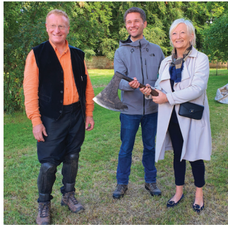
ERMENOUVILLE Château de Mesnil Geoffroy Chantier de reconstitution d'une partie grandeur nature de la charpente de 1220 de la nef de la Cathédrale Notre Dame de Paris, par «Charpentiers sans frontière»