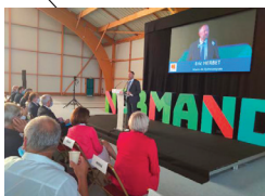
QUINCAMPOIX Réunion des maires du département autour du Président de Région