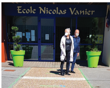
ALLOUVILLE - BELLEFOSSE Covid-19 Découverte du dispositif sanitaire mis en place pour la réouverture de l'école