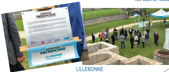
LILLEBONNE Lancement officiel de la restauration du Théâtre Romain Mission Bern 2020