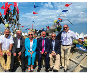
AUBERVILLE SUR MER Fête de la Mer