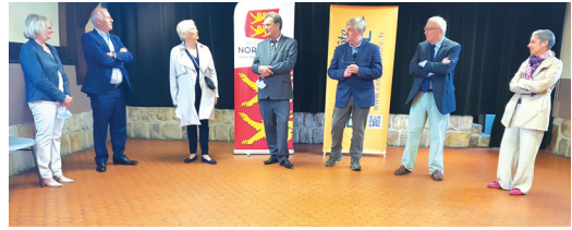
SOTTEVILLE SUR MER Remise de la 1 ère aide impulsion Relance Normandie avec la communauté de communes de la Côte d'Albâtre