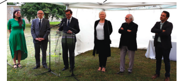
JUMIEGES Dans le cadre du festival Normandie Impressionniste, inauguration de l'exposition «Les flots écoulés ne reviennent pas à la source»