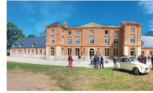
SAINTE MARGUERITE SUR MER Inauguration de la fin de chantier de restauration du château, un nouveau lieu d'activités économiques et culturelles