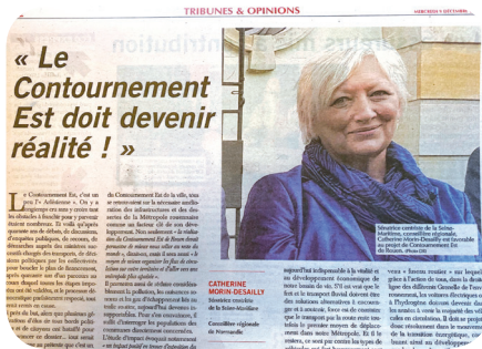
Tribune parue le 09.12.2020

J'ai ainsi demandé au ministre des transports, Jean-Batiste DJEBBARI si l'Etat était toujours engagé pour réaliser au plus vite cette infrastructure nécessaire au désengorgement de la ville de Rouen, à l'amélioration des conditions de vie des habitants des communes riveraines et à l'attractivité économique de la Métropole Rouen Normandienne.