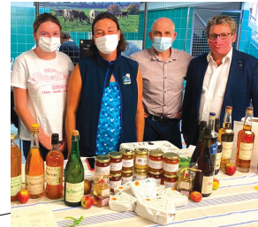
NEUFCHATEL EN BRAY Fête du Fromage