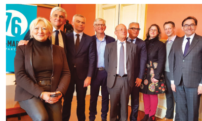
BARENTIN Signature du contrat de territoire Région - Département - Communauté de communes Caux-Austreberthe