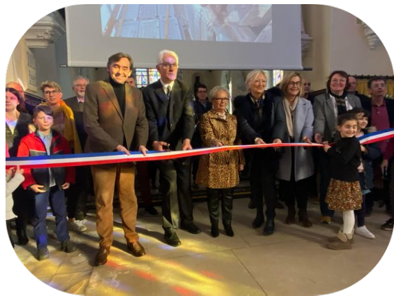
Vattetot-sous-Beaumont - Inauguration des travaux de l'Eglise