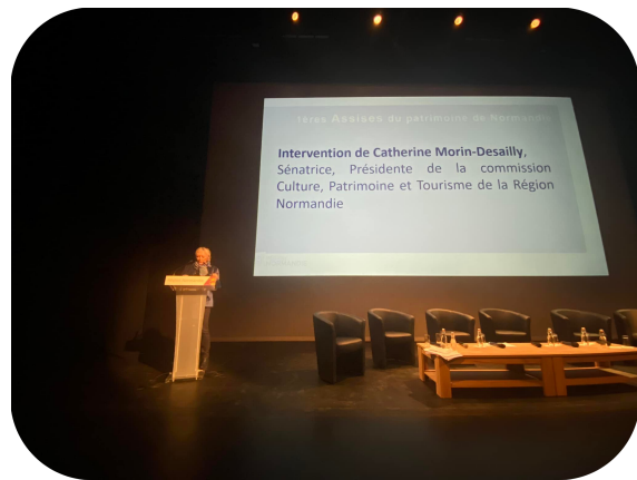
Bayeux - Assises du Patrimoine organisées par la Région Normandie