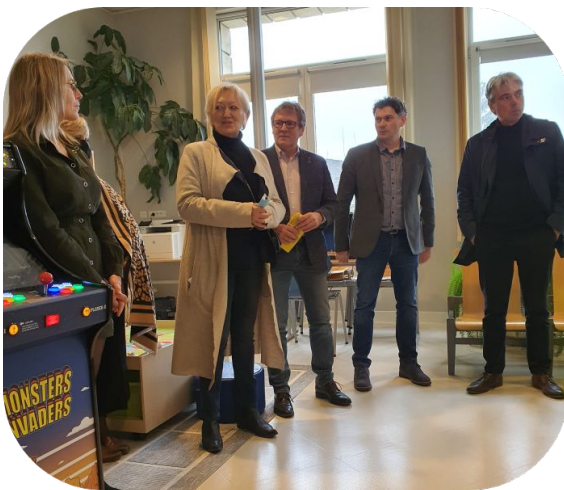
Neufchatel-en-Bray - Inauguration de la Ludothèque