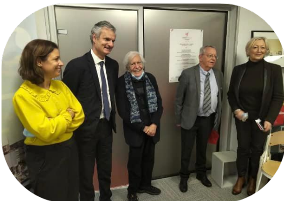
Le Havre - Inauguration de l'Alliance Française