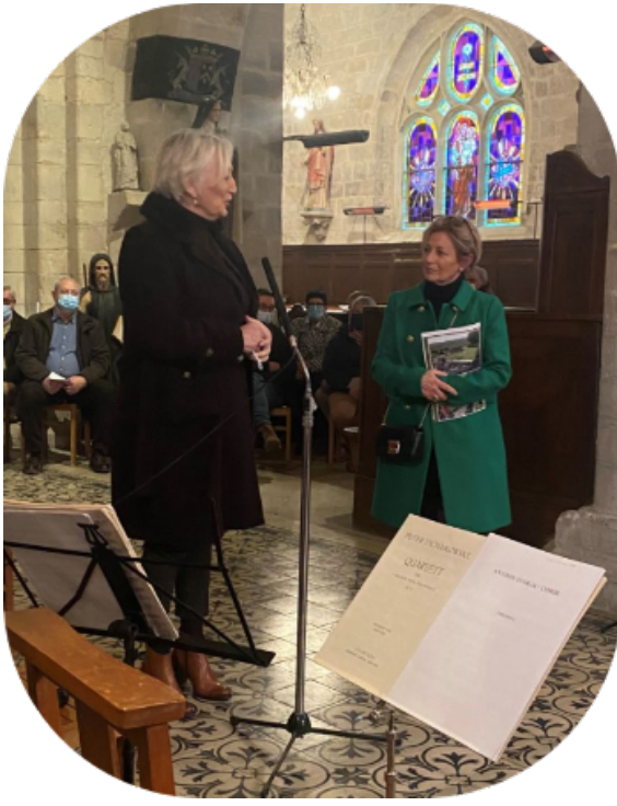
Lammerville - Inauguration des travaux de l'Eglise