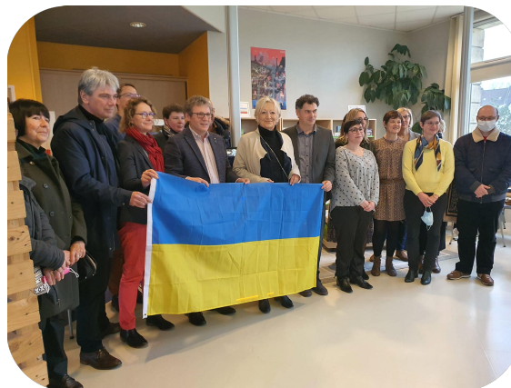
Neufchâtel-en-Bray - Soutien au peuple Ukrainien