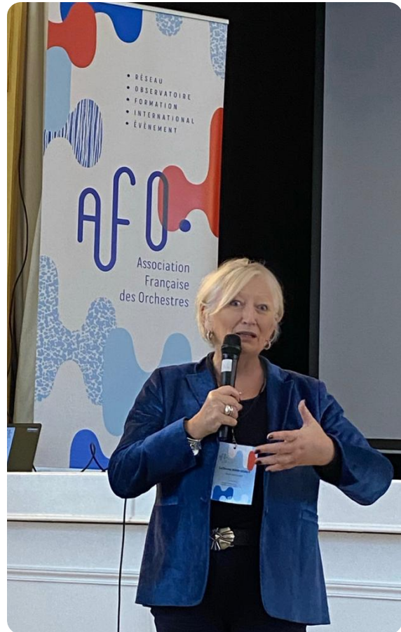
PARIS - Journée de travail de l'Association Française des orchestres (AFO)