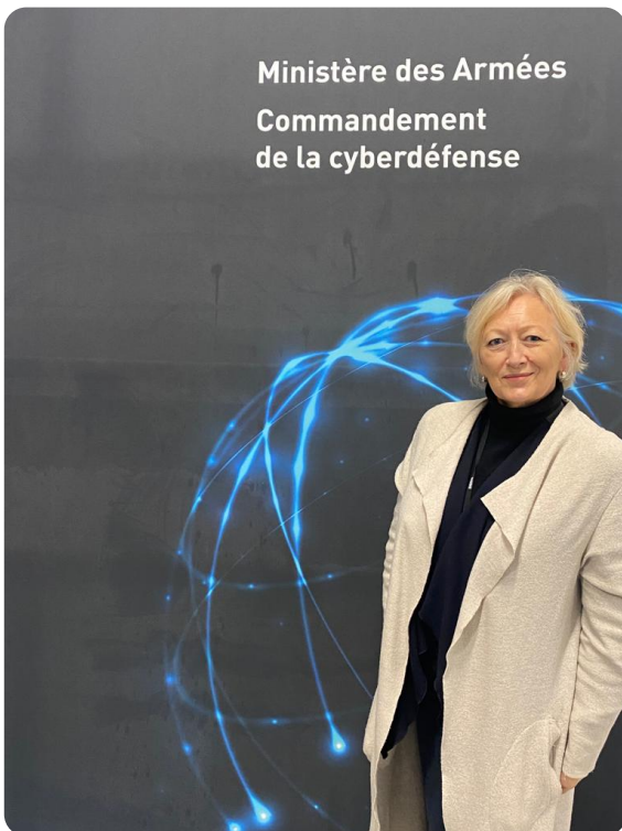
Boulay-les-Trous - Visite de la Direction Générale de la Sécurité Intérieure dans le cadre de ma formation à l'Institut des Hautes Etudes en Défense Nationale (IHEDN) en "Souveraineté numérique et cyber sécurité"