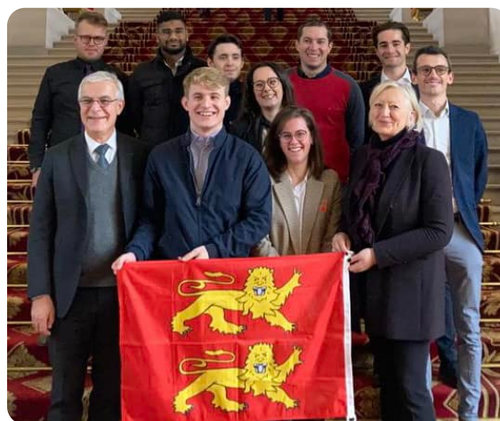
PARIS - Accueil des "Jeunes Normands Conquérants" au Sénat, une association citoyenne mobilisée pour sa Région