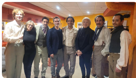
SAINT-ETIENNE-DU-ROUVRAY - Représentation au Théâtre Le Rive Gauche du "Voyage de ma Vie" dans le cadre du bicentenaire de Flaubert 21