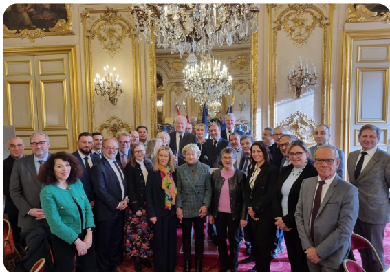
PARIS - Accueil au Sénat d'une délégation de la Chambre des Conseillers du Maroc