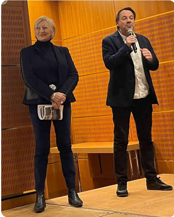
Paris- Conférence de presse de l'Armada de Rouen 2023 au Salon Nautique de Paris