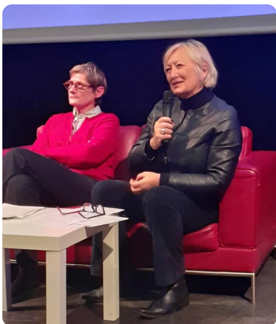
CAEN - Conférence Régionale des professions du Spectacle en compagnie de la DRAC en compagnie de Frédérique Boura, Directrice Régionale des Affaires Culturelles