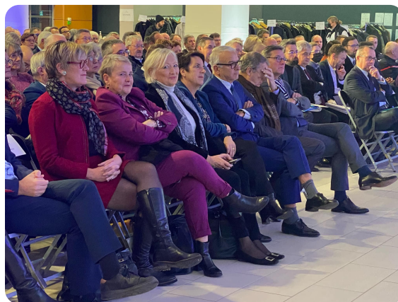
ROUEN - Hôtel du Département - Assemblée Générale annuelle de l'association des maires de Seine-Maritime