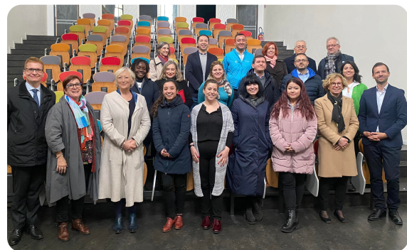
ROUEN - Hôtel de Région - Discours de clôture autour des enjeux de sauvegarde et valorisation du patrimoine à l'occasion de la semaine de formation internationale organisée par la Région Normandie et l'Association Sites & Cités remarquables de France