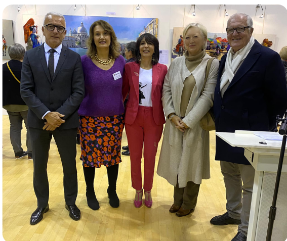
ISNEAUVILLE - Vernissage du 15ème Salon d'arts plastiques d'Isneauville