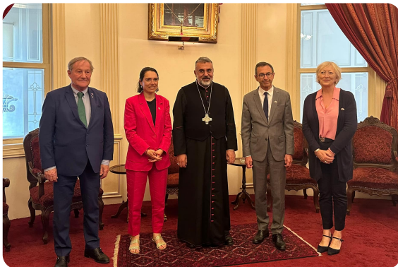
LIBAN - mission sénatoriale - Chrétiens d'Orient