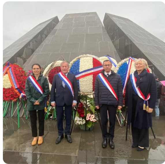
ARMENIE - Vice-présidente du groupe "Chrétiens d'Orient" du Sénat, je me suis rendue en Arménie, au Liban et en Egypte pour soutenir les minorités chrétiennes, mesurer l'implication de la France dans la coopération en faveur du développement, de la santé, de l'éducation et promouvoir le dialogue inter religieux.