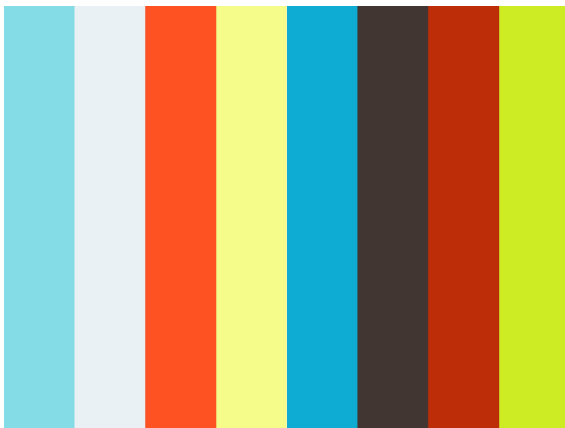
Table ronde sur les actions à mener pour attirer les jeunes femmes vers le secteur du Numérique et des nouvelles technologies

Vous trouverez mes deux interventions en français et en anglais ci-dessous.