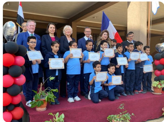
EGYPTE - mission sénatoriale - Chrétiens d'Orient