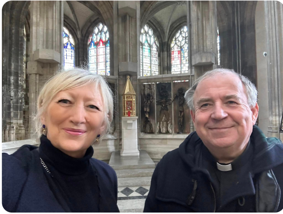
ROUEN - Eglise Saint-Maclou - 18ème Edition du festival Courant d'Art, soutenu par la Région Normandie, qui se déroule dans plusieurs églises de la Seine-Maritime.