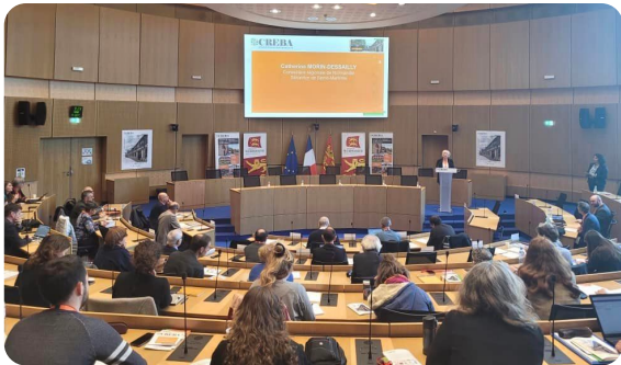
ROUEN : Participation au 4ème colloque CREBA à l'Hôtel de Région