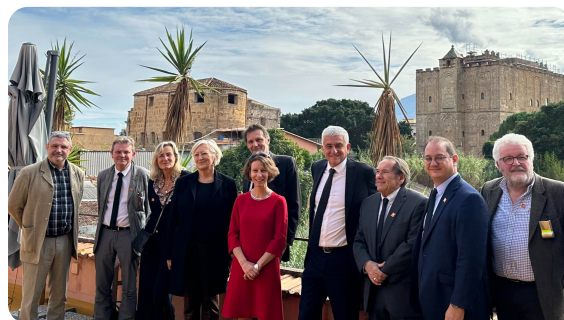
SICILE : Déplacement en Italie avec le président de la Région Normandie dans le cadre du projet Millénaire Guillaume