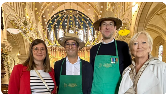
ROUEN : Festivités de la Saint Fiacre, émerveillée par sa végétation riche et abondante