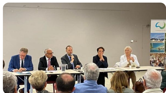
QUINCAMPOIX : Réunion avec les maires de l'intercommunalité Inter-Caux-Vexin pour