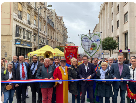
ROUEN : Ambiance joyeuse pour l'inauguration de la fête du ventre et de la gastronomie normande de Rouen avec la présence nombreuse des élus, des associations et confréries