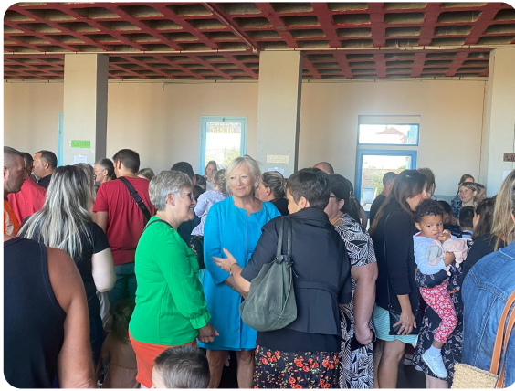
FORGES-LES-EAUX : Rentrée des classes à l'école primaire et maternelle.