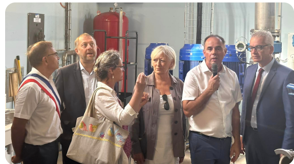
MONTEROLIER : Visite et inauguration de la nouvelle usine de traitement d'eau potable