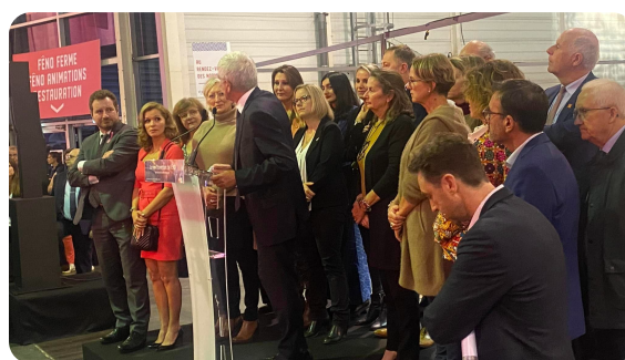
ROUEN : Inauguration de la 5ème édition du Festival de l'excellence Normande au Parc des expositions