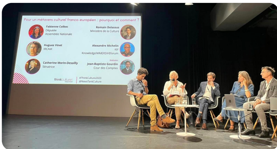
PARIS : Intervention lors de la rentrée du thinkculture ! news tank sur le thème "Culture et numérique : la révolution permanente" organisé au Centre Pompidou