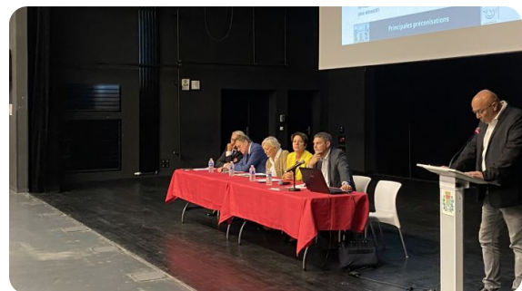
GODERVILLE : Réunion avec les élus de Seine-maritime sur le métier de secrétaire de mairie en compagnie du sénateur Cédric VIAL