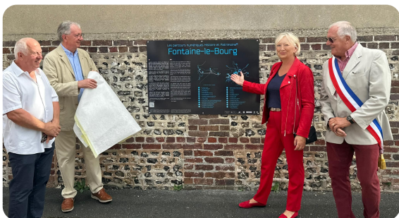
FONTAINE-LE-BOURG : Inauguration du parcours patrimoine qui met en valeur