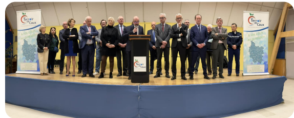
VAL-DE-SCIE - Cérémonie de vœux de la Communauté de Communes Terroir de Caux

PARIS - Inauguration de la 28ème édition du Salon du Patrimoine au Carrousel du Louvre. Y étaient présentes de nombreuses associations de défense du territoire ainsi que de nombreuses entreprises de notre territoire de la Seine-Maritime.