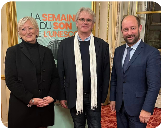
PARIS - 21ème édition de la Semaine du Son.