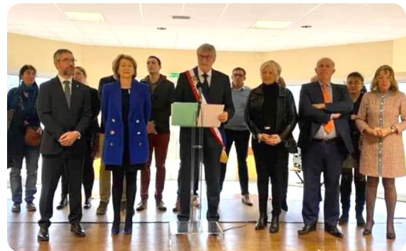
BIVILLE-LA-BAIGNARDE - Cérémonie de vœux de la commune