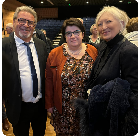
FORGES-LES-EAUX - Cérémonie de vœux de la commune

PARIS - Inauguration de la 28ème édition du Salon du Patrimoine au Carrousel du Louvre. Y étaient présentes de nombreuses associations de défense du territoire ainsi que de nombreuses entreprises de notre territoire de la Seine-Maritime.