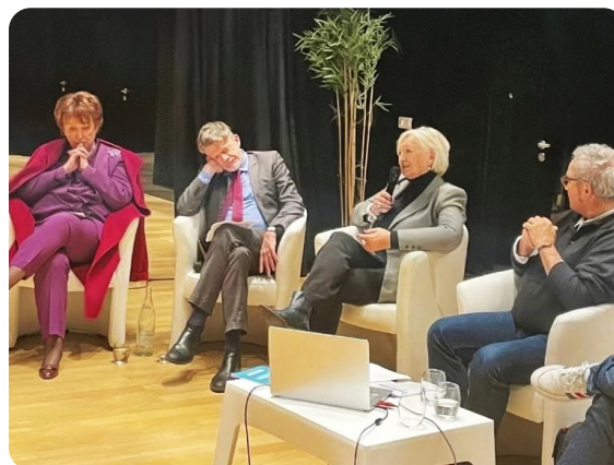
Participation au débat New Deal sur la décentralisation culturelle le 24 novembre à Paris

Au Sénat , un débat sur le thème "Accès à la culture dans les territoires ruraux" s'est tenu le 6 janvier dans l'hémicycle, à l'occasion duquel j'ai interrogé la ministre de la Culture sur la pérennité du soutien aux plus petites structures et lieux intermédiaires en ruralité.