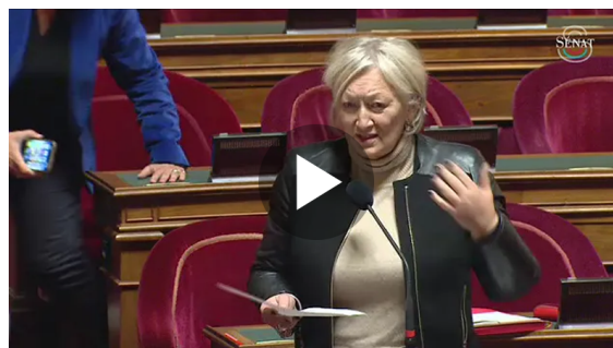
Retrouvez mon intervention lors du débat au Sénat sur l'accès à la culture dans les territoires ruraux en cliquant sur la vidéo ci-dessus