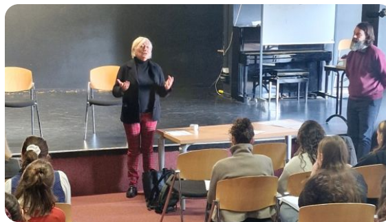
Intervention au lycée Jeanne d'Arc à Rouen sur la restitution des restes humains par les musées français

Je suis ainsi intervenue auprès d'une classe d'histoire de l'art du lycée Jeanne d'Arc de Rouen le 17 novembre sur le thème de la restitution des restes humains par les musées en France.