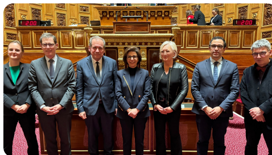
Avec mes collègues sénateurs et la ministre de la Culture à l'issue de l'adoption du texte par le Sénat