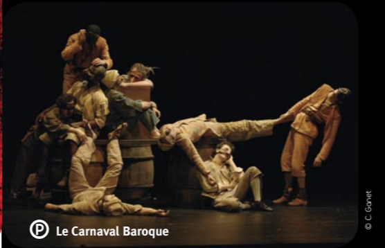
© C. Garnet P Le Carnaval Baroque

[Navettes à votre disposition au départ de chaque ville] Rouen - 02 32 10 87 00 - www.automne-en-normandie.com