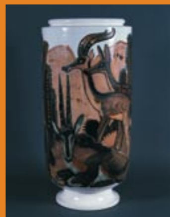
Vase Ruhlmann (Musée de la céramique) présenté en parallèle avec les antilopes du diorama africain du Muséum.

Les trois musées de Rouen (musée des Beaux-Arts, musée de la Céramique, musée Le Secq des Tournelles) proposent un parcours au fil duquel les collections permanentes des musées résonnent en écho avec celles du Muséum, révélant l'évolution conjointe des arts et des sciences. Ainsi, chaque œuvre choisie s'enrichit de l'histoire de son double au muséum et permet de (re)découvrir les collections d'une manière particulièrement originale.